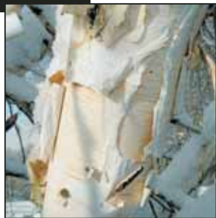
Bouleau de l'Himalaya. JLP

Le bouleau commun, appelé bouleau verruqueux ou Betula verrucosa pour les initiés, a tous les atouts, sauf peut-être celui de la longévité. Ce fringant charmeur de friches donne tellement d'énergie pour s'installer qu'il s'esouffle vite et meurt souvent après quelques décennies. Pareil pour le bouleau noir ( B. nigra ) dont l'écorce se déguise façon gothique dans des tons très foncés et s'exfoliant à tout va, lui donnant une allure décharnée. Le bouleau le plus blanc est le bouleau de l'Himalaya ou B. utilis qui est immaculé de bas en haut, et plus si