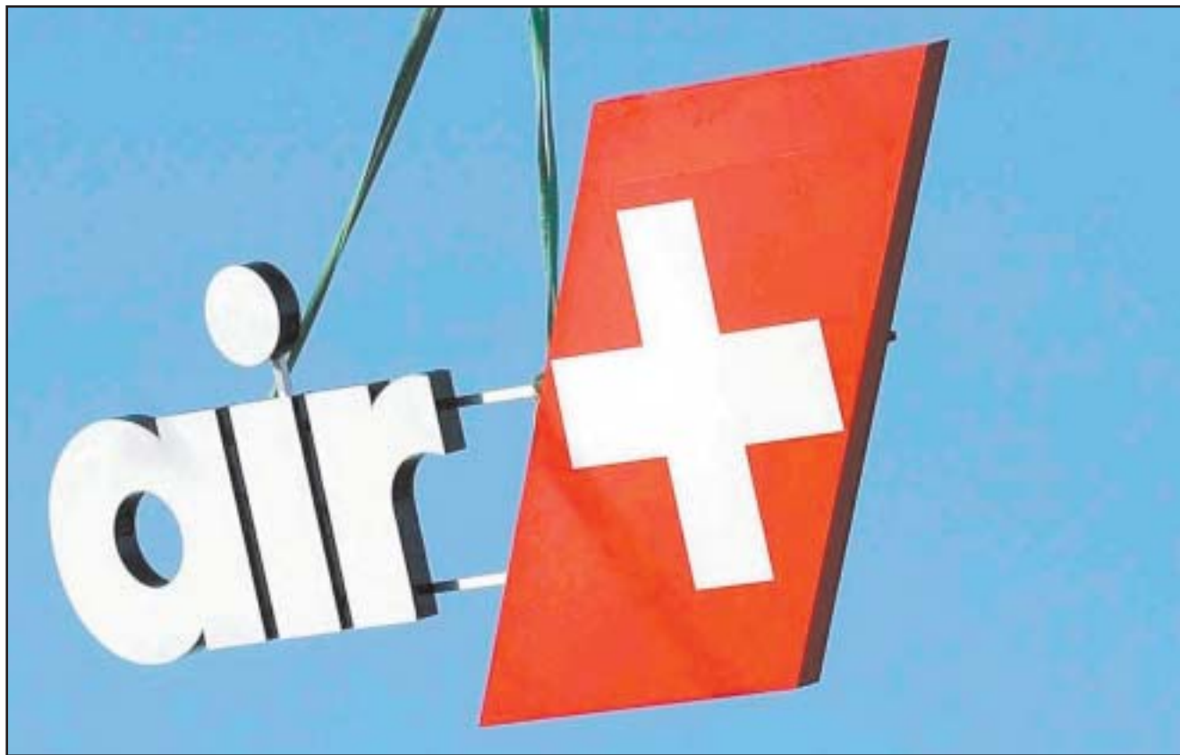
La débâcle de Swissair a été vécue comme une catastrophe nationale. Mais personne ne veut en payer le prix.