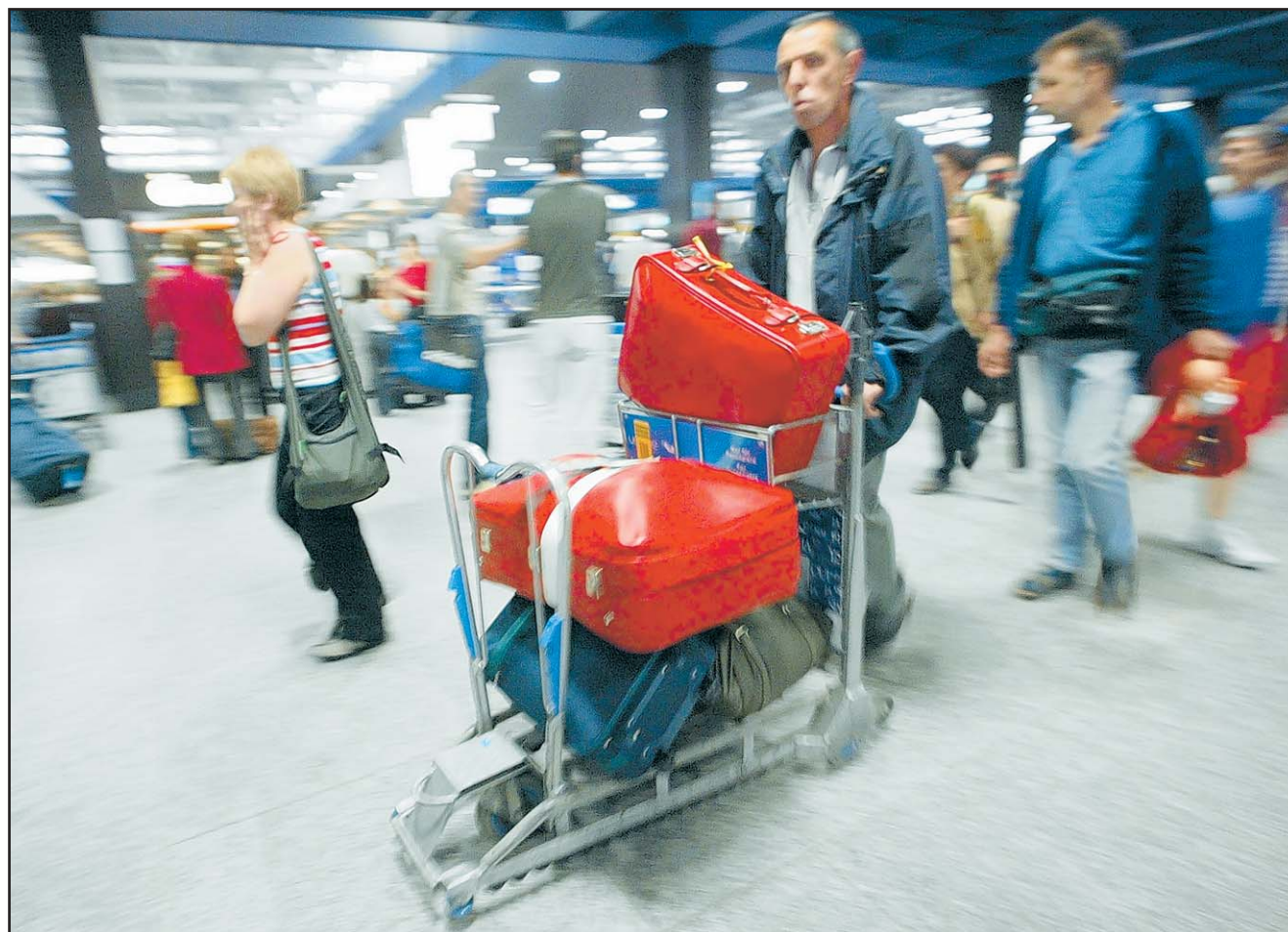
Juste un clic avant de faire ses bagages! Nous sommes toujours plus nombreux à nous passer des agences. KEYSTONE

Sources : Journal du Net, Phocus Wright, TourMag, TNS Sofres, CRT