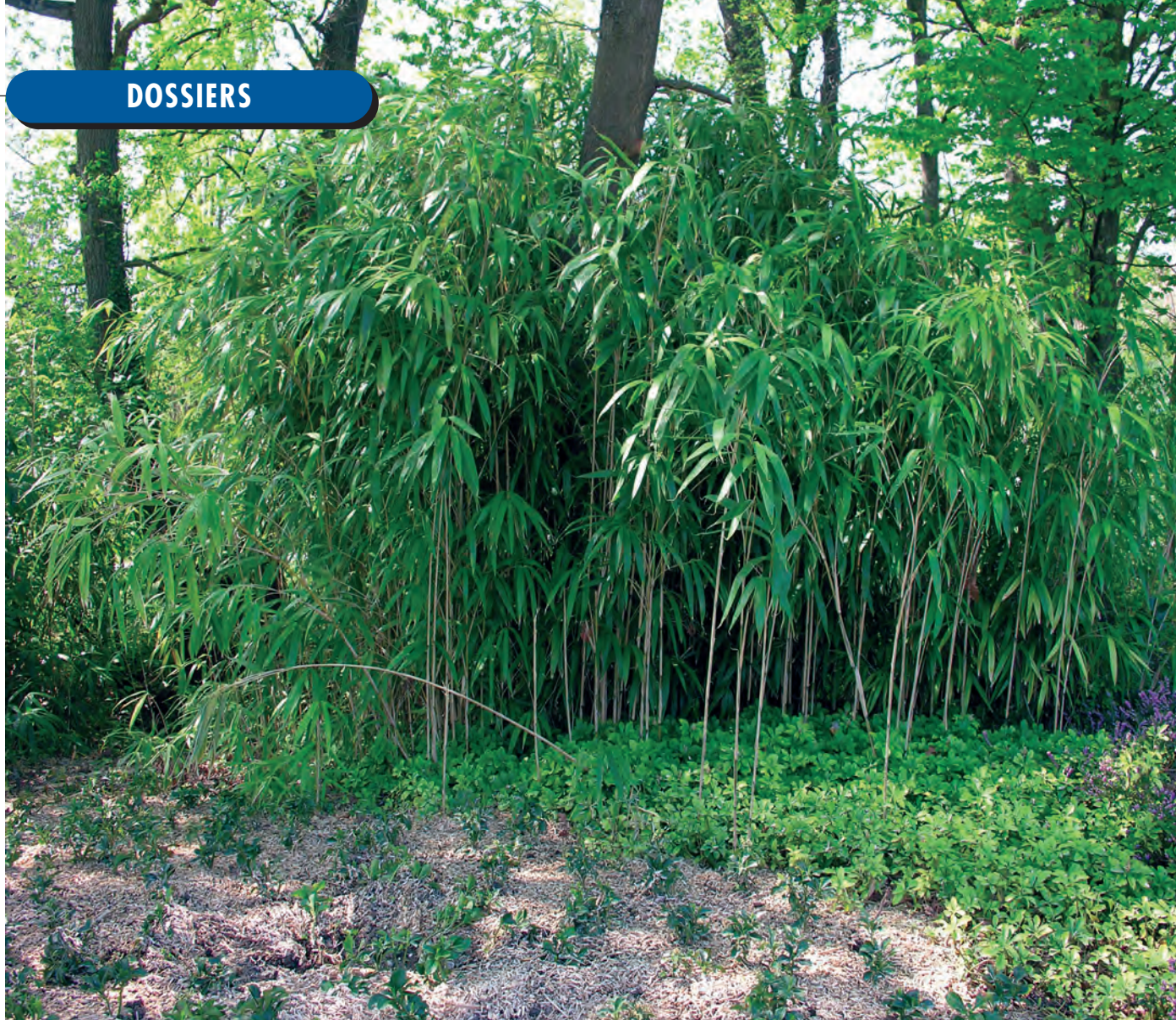
Pseudosasa japonica à l'ombre.