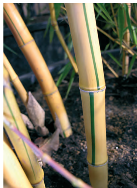
Phyllostachys vivax Aureocaulis.

trompés. Les bambous sont des végétaux extraordinaires, de par leur construction cellulaire, aux caractéristiques physiques dépassant celle du béton armé. Ils plient