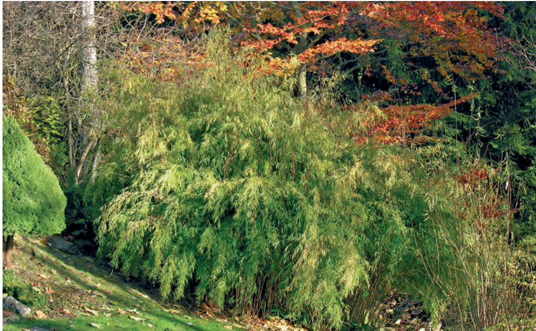
Fargesia au château d'Épendes.

sous la pression, mais le point de rupture est très difficile à atteindre: essayez de casser une tige de bambou! De plus, leur feuillage et leur structure légère en font un invité de choix dans tous les jardins.