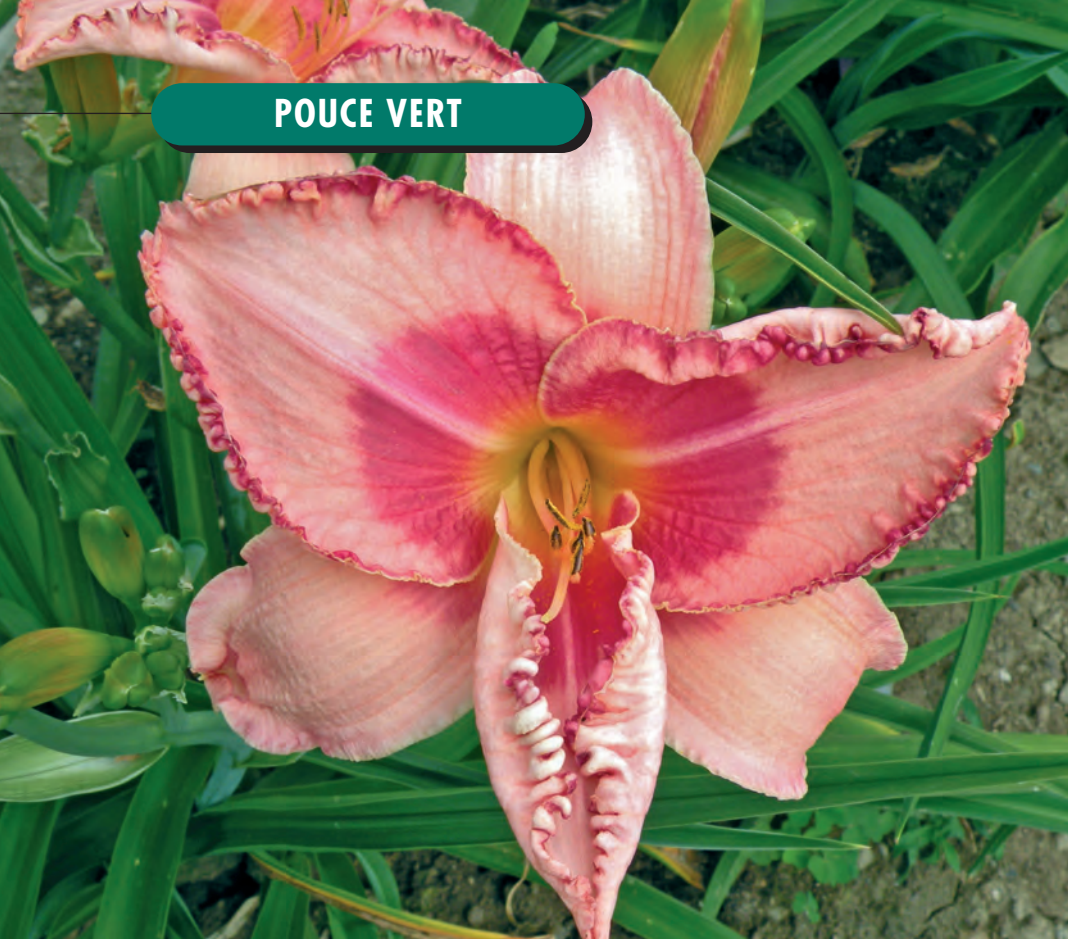
Hemerocallis 'Shanghai Parasol'.

finies en forme d'araignées (les spiders) et fleurs doubles. Les pétales sont plus ou moins frangés ou enroulés. Parmi tous ces types, les couleurs varient dans les tons blancs, jaunes, roses, rouges en passant par l'orange et le brun voire même le bleu violacé, sans compter toutes les variantes possibles de pastels.