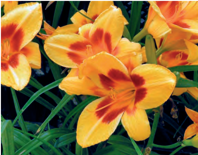
Hemerocallis 'Black Eyed Susan'.

Belles et éphémères, elles incarnent la fougue du renouvellement perpétuel. Jaillissant d'un feuillage fin et élégant, ces magnifiques fleurs aux allures de lys se trémoussent dans la brise estivale.